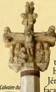
Calvaire du XIV e s.

Saint-Vincent d'Olargues est une ancienne commanderie de l'Ordre des Hospitaliers de Saint-Jean de Jérusalem de Rhodes et de Malte, vous y trouverez une sculpture dédiée à l'Ordre des hospitaliers de Saint-Jean de Jérusalem, incluse dans la façade de l'église du village.