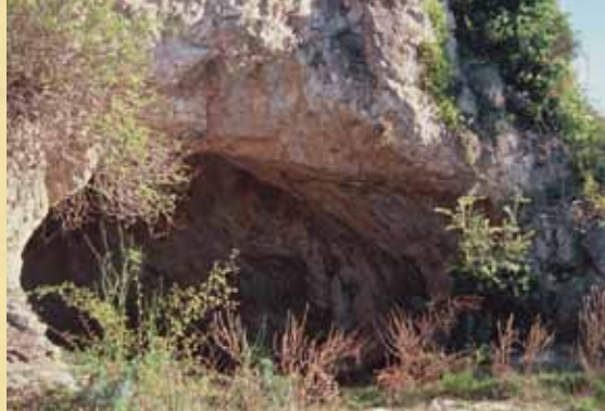
Grotte de Camprafaud